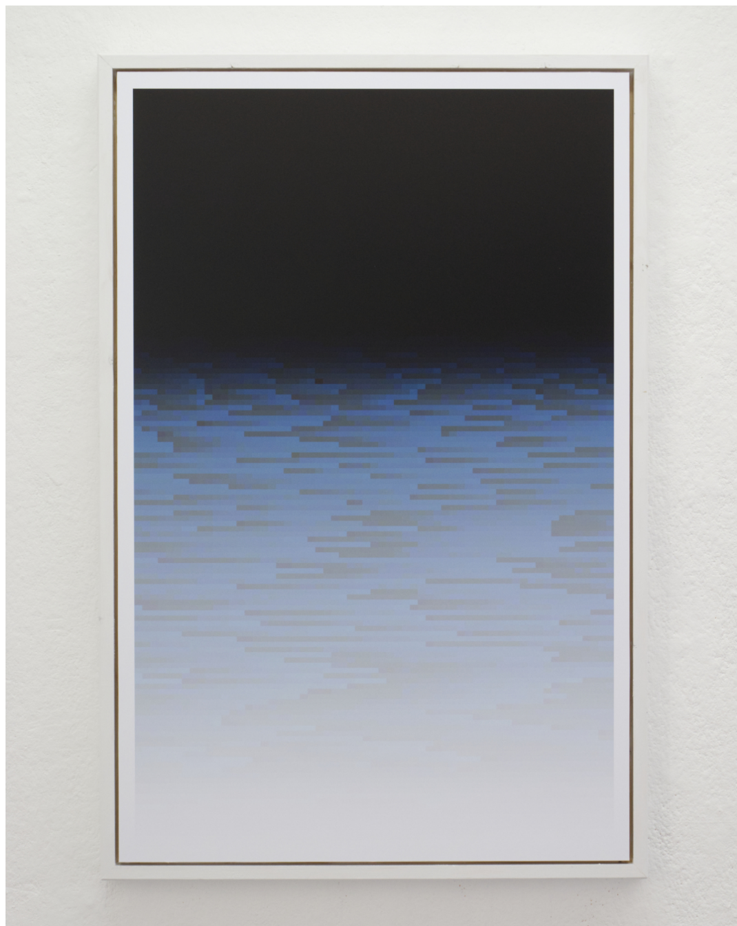
8.784 Farben 70x108cm